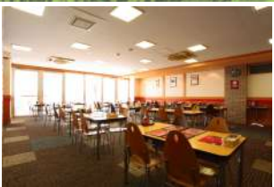
6 イタリアンレストラン「軽井沢プリモ」