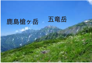
3 迫力の北アルプスの稜線