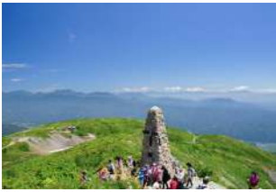
2 八方ケルンから見渡す360°の山並み