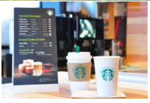
5 八方うさぎ平カフェ