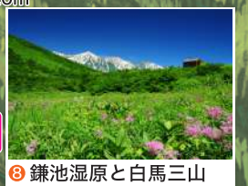
8 鎌池湿原と白馬三山