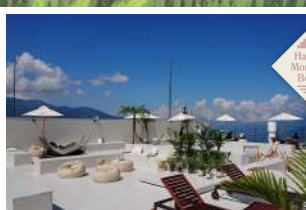
7 HAKUBA MOUNTAIN BEACH