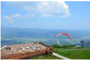
4 Corona Escape Terrace